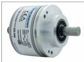
Inkrementaler Drehgeber WDG158B

Stellen Sie sich Ihre Messeinheit passend für Ihre Schachtkopierung zusammen, indem Sie sich Ihren Drehgeber auswählen und die Länge des Spezialriemens bestimmen.