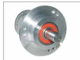
Absoluter Drehgeber WDGA58B